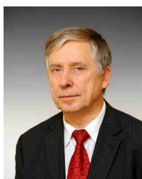
Připravil: Ing. Karel Žák, poradce SON ČR a Rady seniorů ČR, člen ZMH

Sdružení nájemníků ČR jako celorepubliková organizace se kromě poradenské činnosti, kterou organizujeme i ve spolupráci s Radou seniorů ČR, podílí na připomínkování návrhů právních předpisů, na organizaci workshopů a seminářů k problematice bydlení.