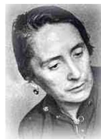
DOLORES IBÁRRURI GÓMEZ

První protestní masové akce žen zaznamenáváme v Severní Americe již v roce 1829. Historicky doložená je pak stávka z 8. března 1908 v textilní továrně v New Yorku, kdy 15 tisíc pracovníků žádalo zlepšení pracovních podmínek a zajištění volebního práva pro ženy. Bohužel tato akce skončila katastrofou následkem požáru, který vznikl ve fabrice a který ukončil život 129 stávkujících žen.