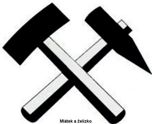
Mlátek a želízko