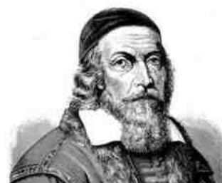
Jan Amos Komenský učitel národů (1592–1670)

Ale protože i my máme mezi sebou učitelky a učitele, kteří na svou práci už jen vzpomínají, blahopřejeme aspoň takto.